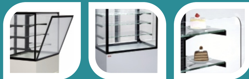
Samoobslužná verze / Self-service version