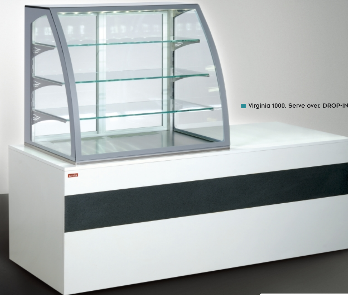
■ Virginia 1000, Serve over, DROP-IN