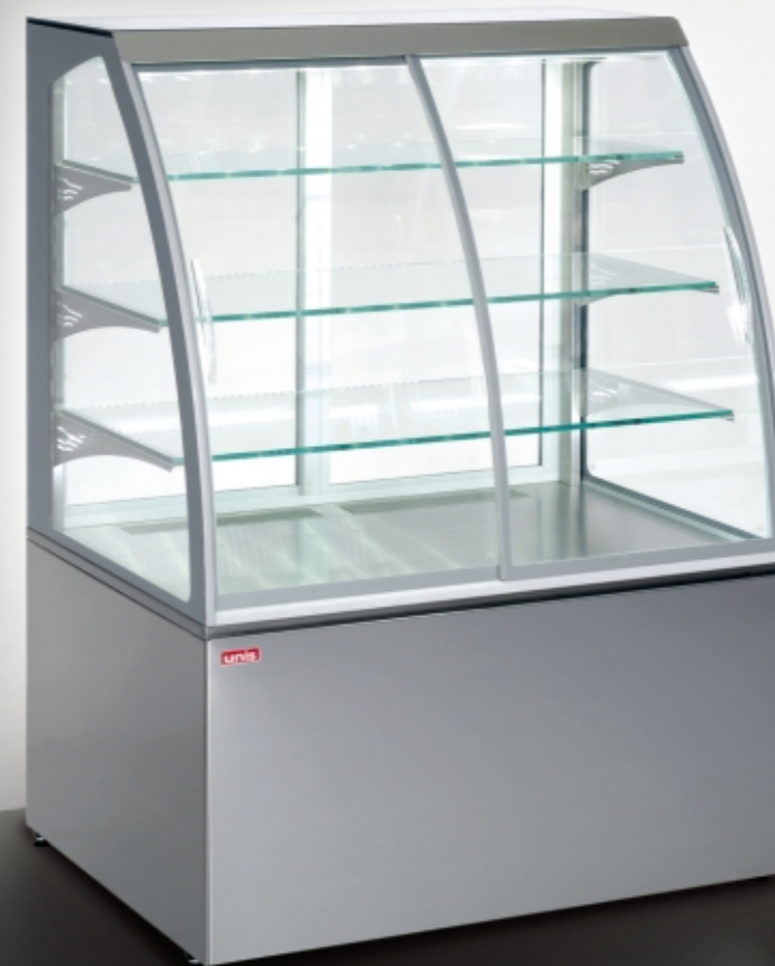
■ Virginia 1000 Self-service INOX