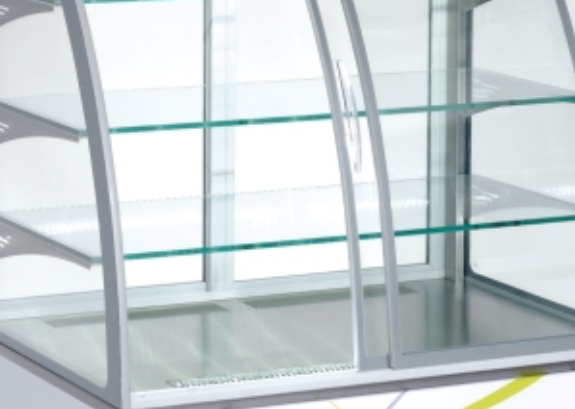
Detail of opened front sliding doors (self-service) / Detail der Öffnung der Fronttür (self-service)