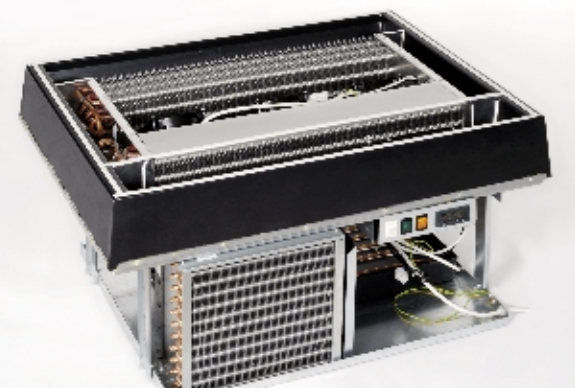
Cooling unit. Quick and easy dismantling / Kühlaggregate. Einfacher und schneller Abbau