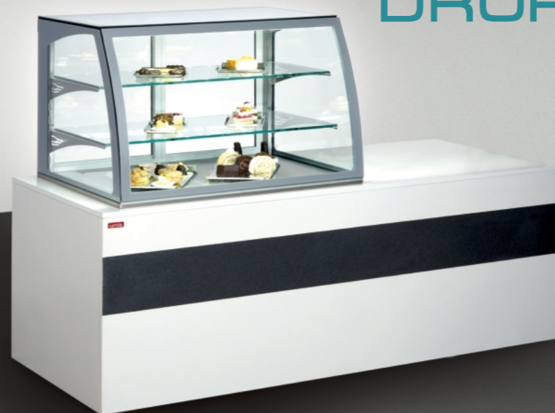
■ Virginia 1000 Low DROP-IN built-in counter

■ The showcase can be produced in DROP-IN modification which is suitable for installation into issue counter. ■ Die Glasschränke können auch in einer DROP-IN Ausführung bestellt werden, die Einbau in Ausgabetheken ermöglicht.