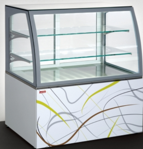
■ Virginia 1000 Low