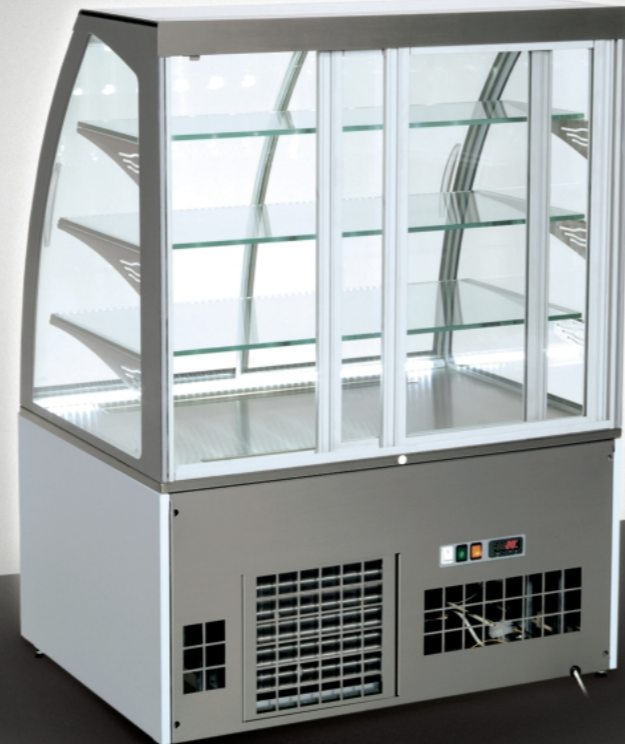
■ Rear view of showcase / Rückansicht auf den Glasschrank