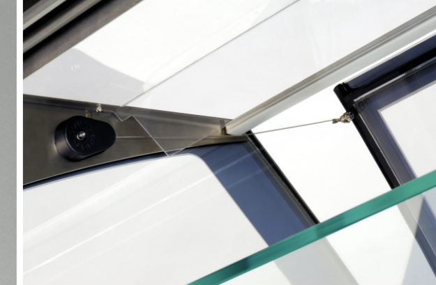
The reel for folding the front glass / Winde, um das Frontglas abzukippen