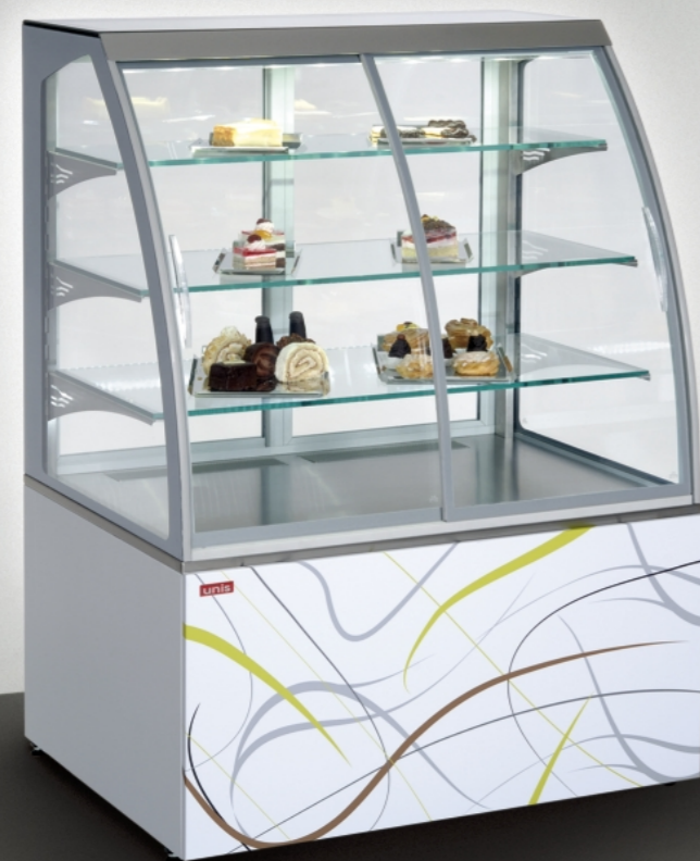
■ Virginia 1000 Self-service