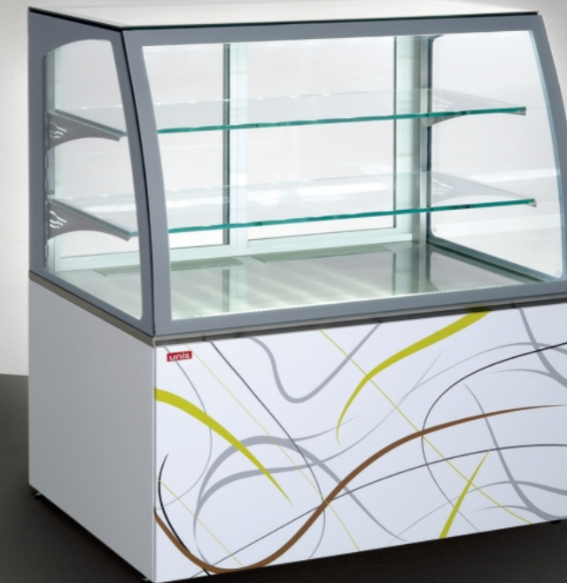
■ Virginia 1000 Low, Serve over