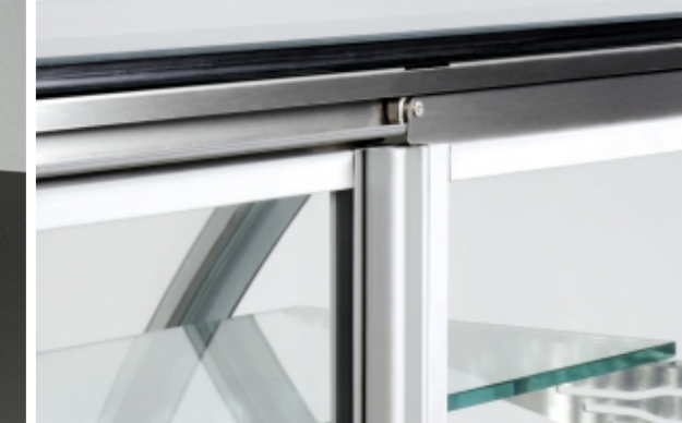
Detail of the door movement system / Tür-Verschiebung Detail